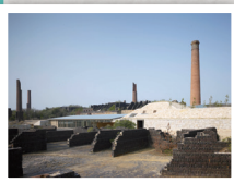
Inujima Seirenscho Art Museum