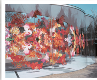
Inujima "Art House Project" A-Art House Haruka Kojin / reflectwo, 2013 Photo: Takashi Homma

地址：岡山市東區犬島 327-4 電話：+81-86-947-1112 開館時間：10:00 ~ 16:30 (最終入館 16:00) 公休：星期二 (3/1 ~ 11/30) 星期二 ~ 星期四 (12/1 ~ 2 月底) 若遇節日則開館並隔日休館；若遇星期一為節日則星期一、二皆開館，星期三休館 交通方式：JR 西大寺站搭乘巴士約 40 分鐘至西寶傳，步行 3 分至寶傳港坐船至犬島約 10 分鐘 網站： http://benesse-artsite.jp/art/seirenscho.html